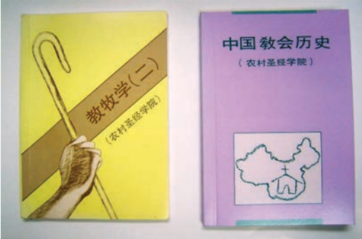
● 農村聖經學院的教材