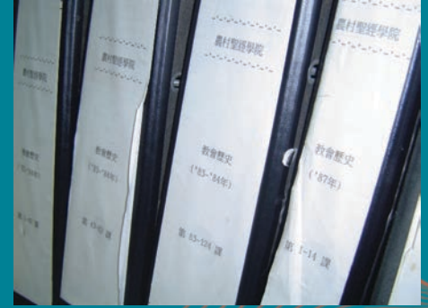
● 農村聖經學院的講義