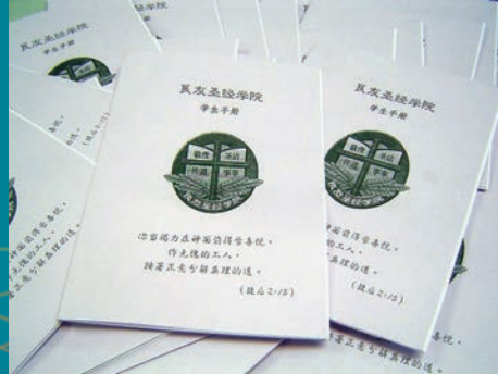
● 良友聖經學院學生手冊