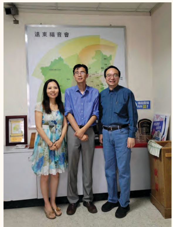
●拜訪台灣遠東福音會